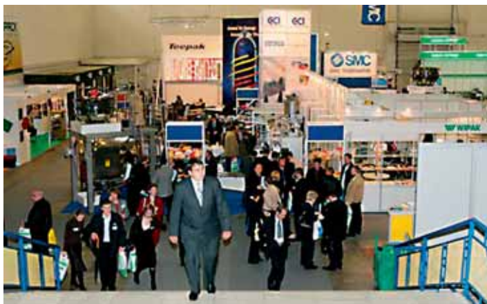
В 2007 году выставку посетили более 18500 человек.