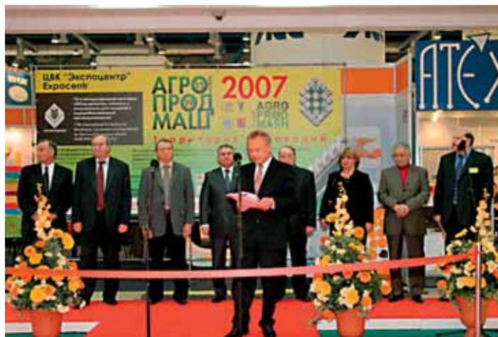
Каждый год проводится международная выставка оборудования для пищевой промышленности «Агропродмаш»

Первая выставка «Агропродмаша» проводилась в 1996 году. За 12 лет метраж экспозиционной площади увеличился более чем в 3 раза – свыше 22500 кв. метров в