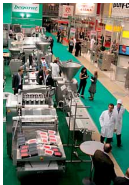
«Агропродмаш» в комплексе позволяет демонстрировать новейшие технические и технологические решения в сфере пищевой продукции.

В рамках салона также предусмотрена обширная деловая программа, в том числе проведение конференции, посвященной экономическим аспектам использования ингредиентов в производстве продуктов питания. Данный форум проводится РИА «Империя» при активной поддержке Союза производителей пищевых ингредиентов и крупнейших компаний отрасли.