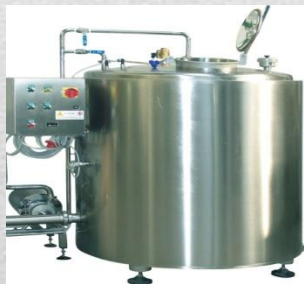
Приготовитель горячей воды