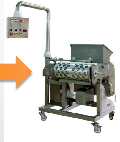
Формовочная машина для моцареллы