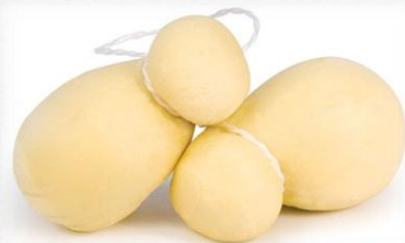
Скаморца – Скаморца – «сухая моцарелла» «сухая моцарелла»