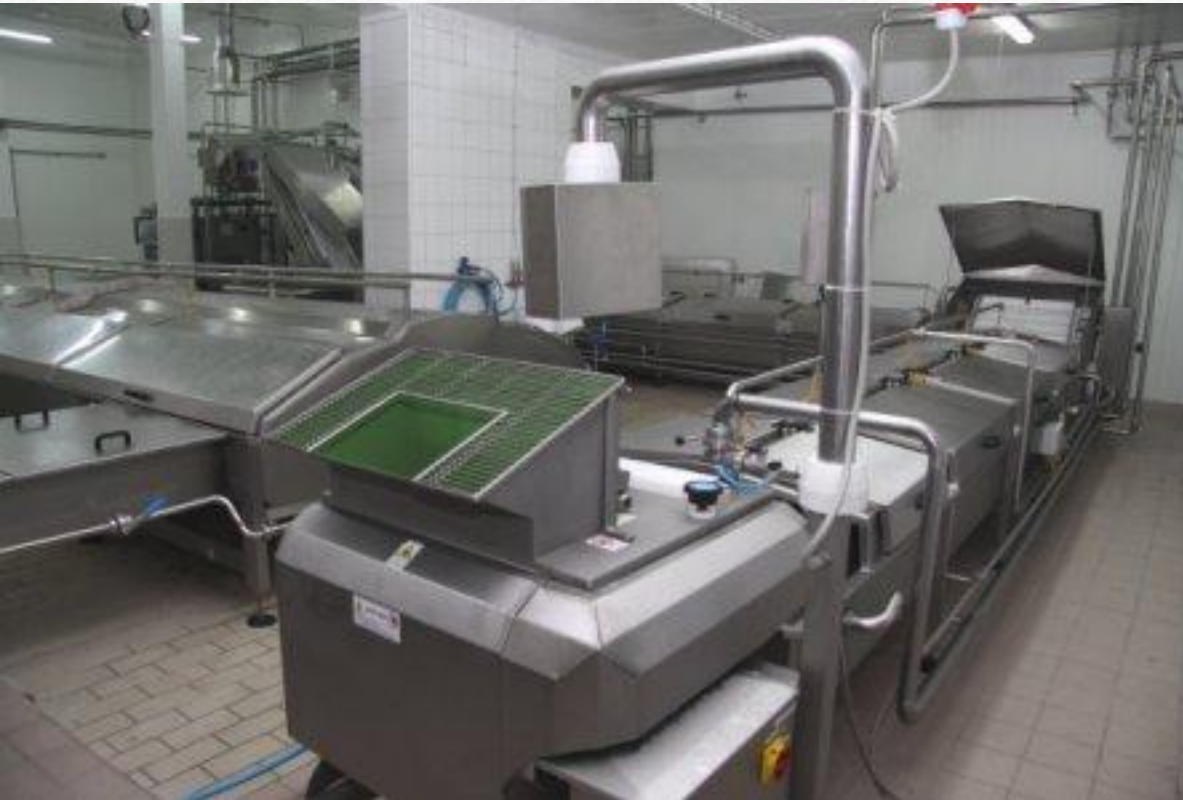
Линия предварительного охлаждения и уплотнения для моцареллы