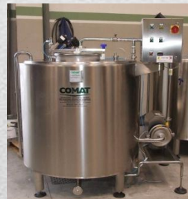
Приготовитель и дозатор жидкой соли