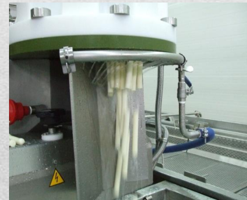
ФОРМОВОЧНАЯ МАШИНА ДЛЯ СТИК МОЦАРЕЛЛЫ