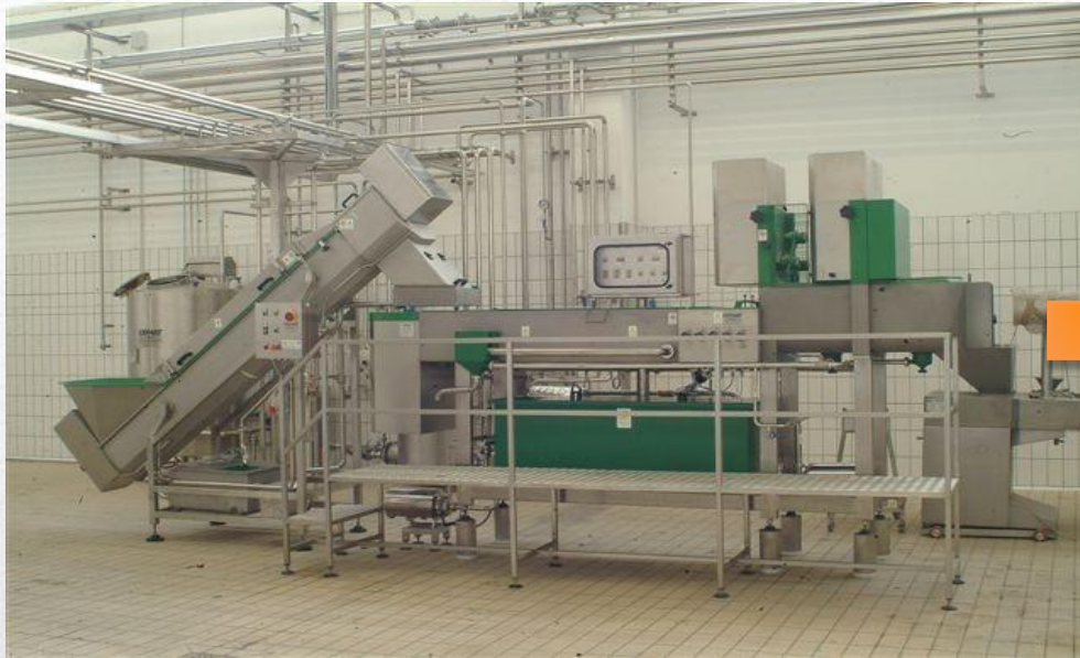
Непрерывная растяжная машина