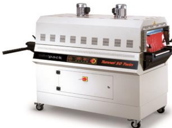
TUNNEL 50 TWIN