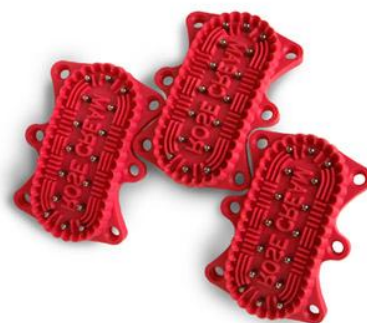
Формочки для вырубных роторов