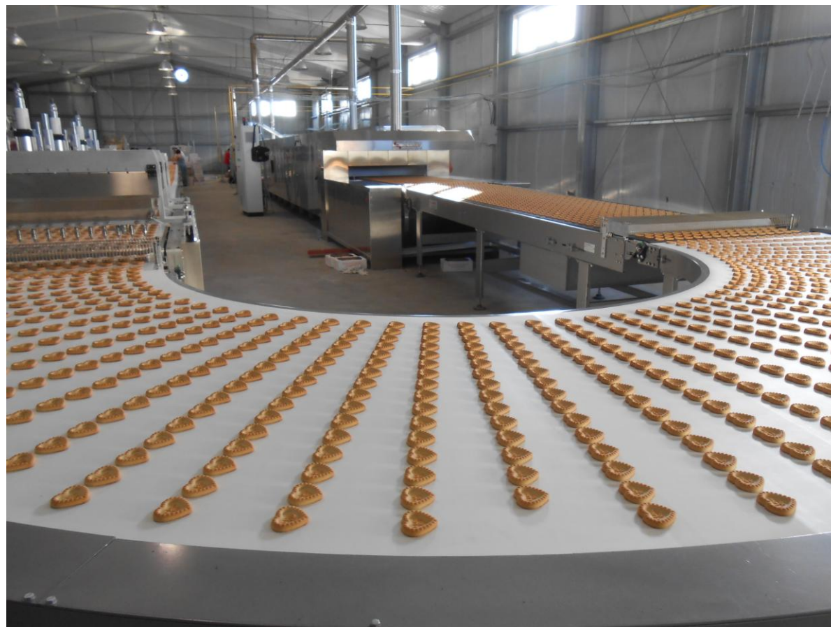
Линия сахарного печенья с декорированием 1200 мм (Минск-Белоруссия)