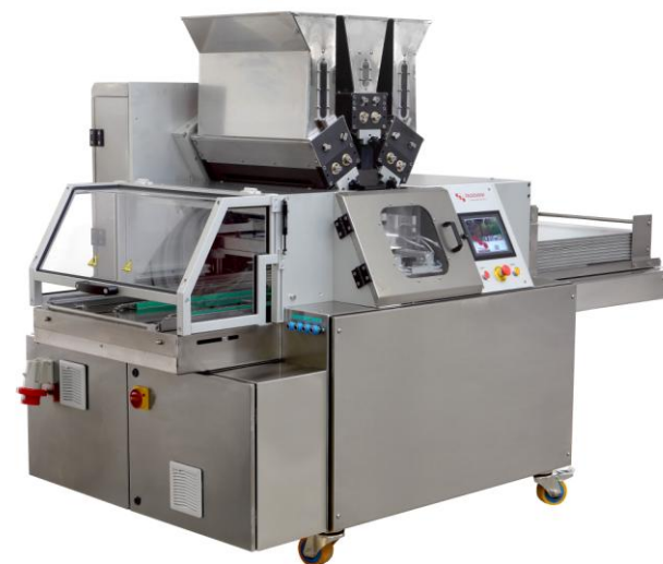
Формующая машина с выкладкой на противень мод. ALADIN 600 для печенья с начинкой и струнной резки