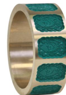
Кольца для вырубных и формующих роторов