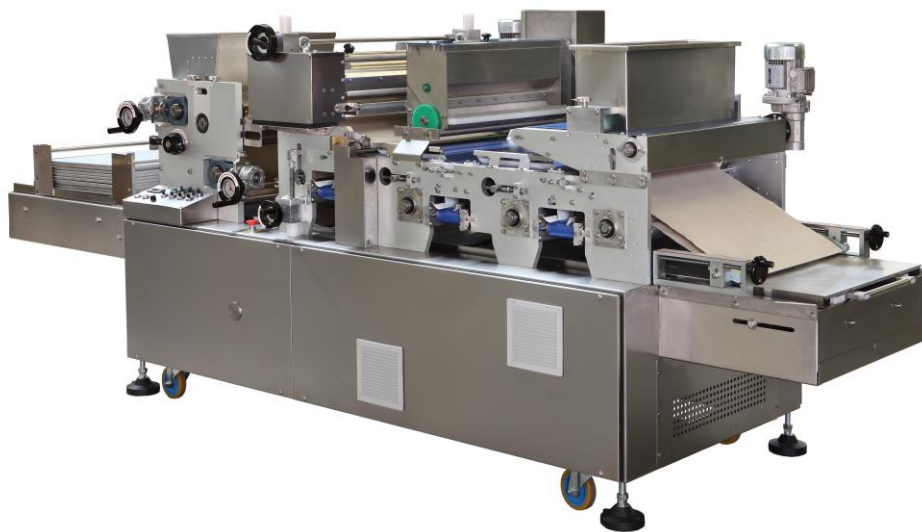
Ротационная машина мод RDZ (формовка + помазка + дозировка джема + обсыпка сахаром + обсыпка семечками, дробленным орехом, измельченным цукатом и пр.)